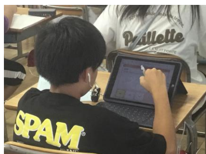
【ミライシード(AIドリル)に取り組む】