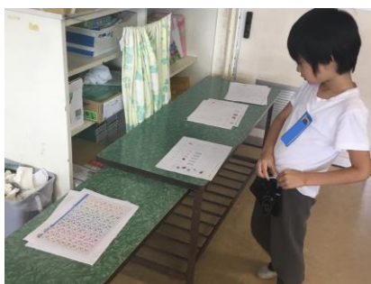
【自分に合ったプリントを選ぶ】