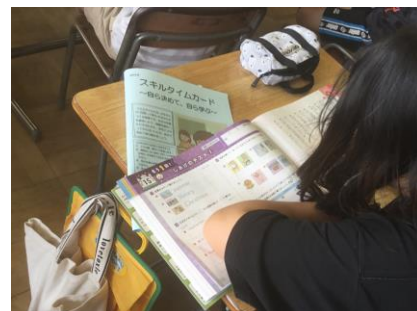
【家から持ってきた問題集に取り組む】