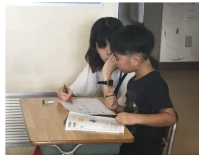
【教師も個別にサポートします】