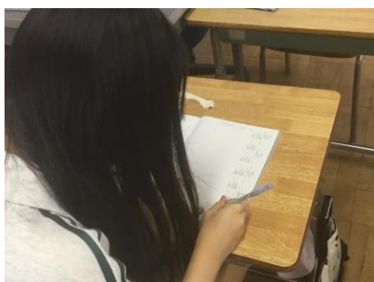
【ノートに漢字の練習をする】